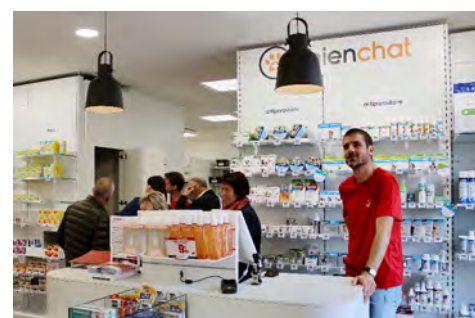
Les élus visitent la pharmacie.

douce selon des modalités souples, proches de l'hôtel d'entreprises. Enfin, l'ancienne pharmacie, rue des Seigneurs, devrait accueillir les services administratifs communaux le temps de rénover et d'agrandir la mairie, puis cherchera une autre vocation.