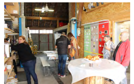
Le 8 octobre, seize artisans, commerçants et autres professionnels ont accueilli le public lors de la Journée nationale du commerce de proximité.